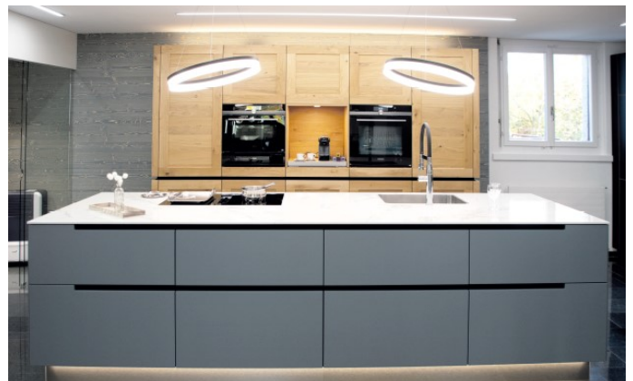
Die täglich geöffnete permanente Ausstellung in Uhwiesen zeigt die aktuellsten Küchentrends.