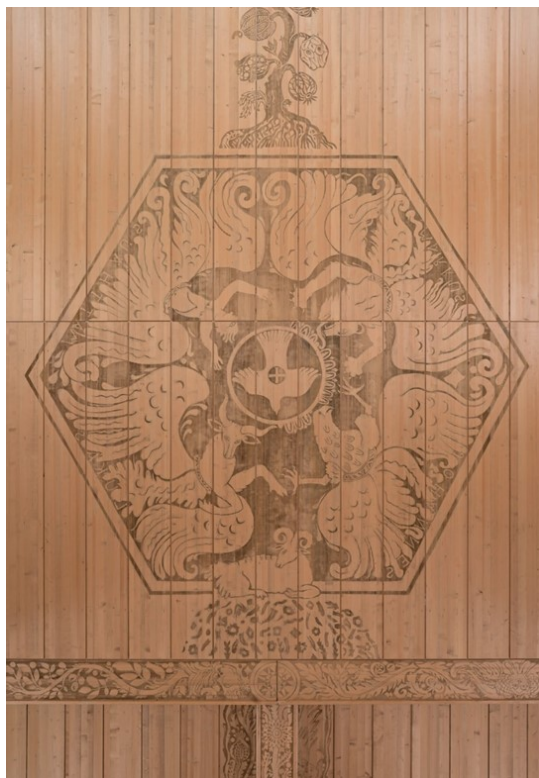
Ausschnitt der Kirchendecke über dem Chor

reformierte kirche marthalen dabei an «Lange Nacht der Kirchen»