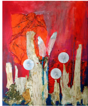
Bernhard Kramer 60 Jährig Bilder über 30 Jahre Acryl, Mixedmedia, Popart

Wollen Sie sich abmelden? Brauchen Sie eine Wohnsitzbestätigung? Haben aber keine Zeit um auf der Gemeindeverwaltung vorbeizukommen?