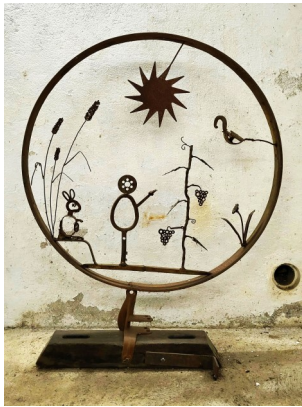
Albert Kramer 90 Jährig Eisenplastiken über 50 Jahre Eisenplastiken, Figuren und Reliefs

Navigation: Berg 1. 8460 Marthalen, genügend Parkplätze vorhanden