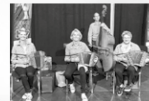
Schwyzerörgeli- Quartett Melissägeischt